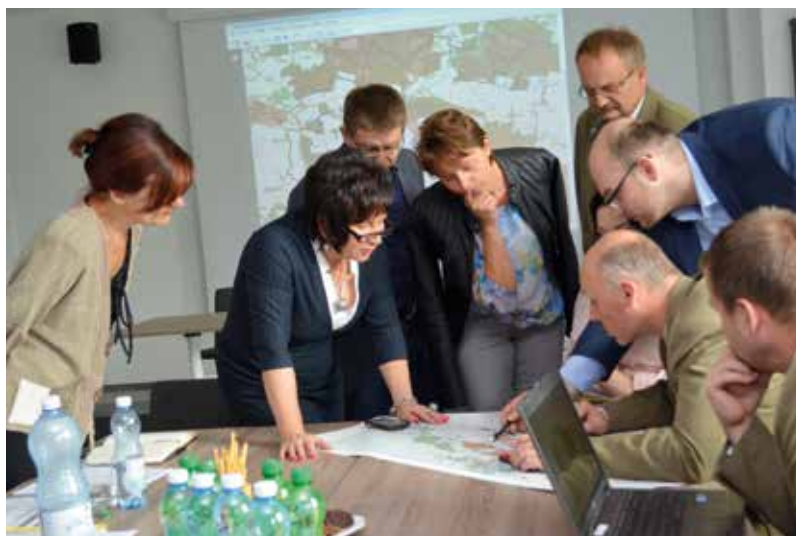
Uzgodnienia projektu z przedstawicielami samorządów w siedzibie WFOŚiGW w Kielcach

w prowadzeniu działań we wspólnej przestrzeni krajobrazowej. Nie bez znaczenia jest to, że projekt stanowiący jednolity system o zasięgu regionalnym ma duże szanse na sfinansowanie ze środków unijnych. Trzeba podkreślić, że w toku spotkań przedstawiciele zaproszonych instytucji wyrazili wolę podjęcia wspólnego przedsięwzięcia, rozwoju współpracy i kontynuowania działań w zakresie wykorzystania środków unijnych w rozwoju regionu świętokrzyskiego.