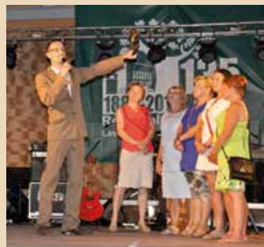
Konkurs gry na rogu myśliwskim

15 sierpnia w Stąporkowie odbyło się święto z bardzo mocno zaznaczonym akcentem leśnym. W Biegu Ciepła 2015 udział wzięli leśnicy z Nadleśnictwa Stąporków oraz zaproszonych sąsiednich nadleśnictw, m.in. Skarżysko i Zagnańsk.