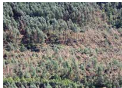
Szkody w nadleśnictwach Chmielnik i Staszów