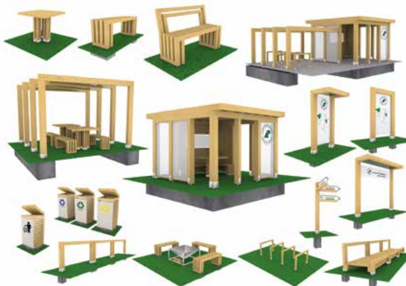
Obiekty standardu w wariantcie nowoczesnym