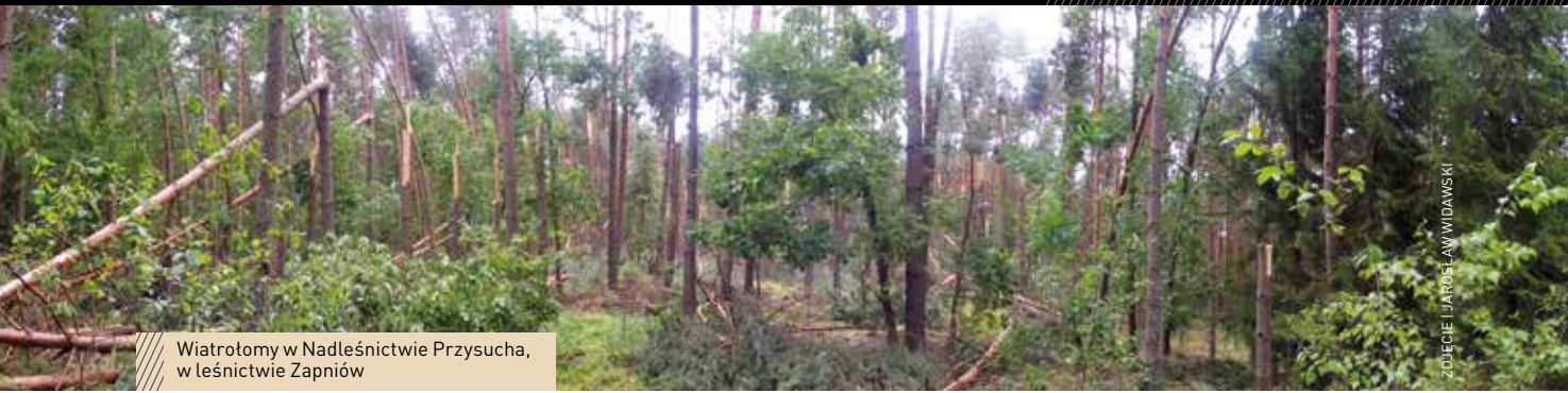
Wiatrołomy w Nadleśnictwie Przysucha, w leśnictwie Zapniów