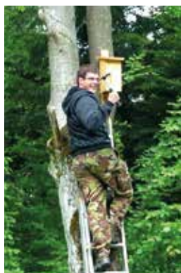
Wieszanie budek dla pilchowatych

Program badań i ochrony pilchów realizowany jest przez Zespół Świętokrzyskich i Nadnidziańskich Parków Krajobrazowych we współpracy ze stowarzyszeniem M.O.S.T. z Kielc i nadleśnictwem.