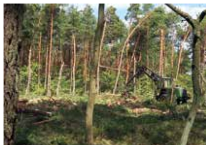
Przy usuwaniu szkód pracują harwestery