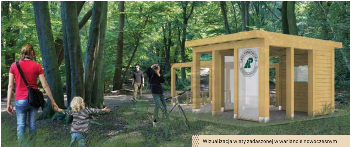
Wizualizacja wiaty zadanej w wariantcie nowoczesnym

GRZEGORZ PAWLEC ARCHITEKTURA KRAJÓBRAZU | WWW.GRZEGORZPAWLEC.PL