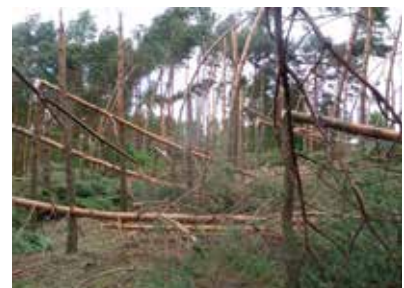
Wiatrołomy w Nadleśnictwie Chmielnik