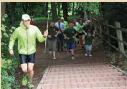
Leśnicy z Nadleśnictwa Zagnańsk też dożyli sporo okrążeń

7 godzin, 56 minut i 35 sekund potrzebowali biegacze, by obiec legendarny dąb 540 razy i poprawić zeszłoroczny rekord. To o 40 okrążeń więcej niż przed rokiem.