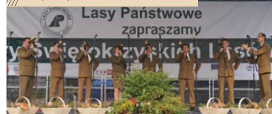
Występ zespołu na „Darach Świętokrzyskich Lasów” w Kielcach

Aby zostać sygnalistą należy posiadać kilka bardzo ważnych cech: po pierwsze – trzeba mieć predyspozycje do gry