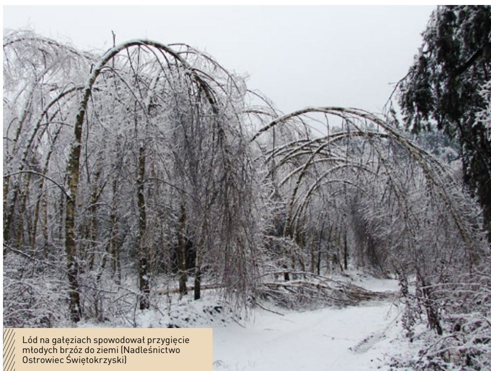
Lód na gałęziach spowodował przygięcie młodych brzoź do ziemi (Nadleśnictwo Ostrowiec Świętokrzyski)