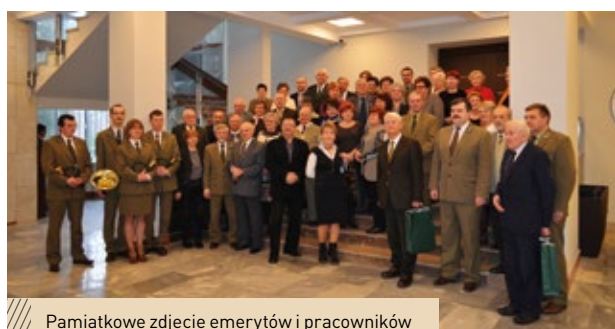
Pamiętkowe zdjęcie emerytów i pracowników RDLP w Radomiu

TEKST | PAULINA GODULA PAULINA.GODULA@RADOM.LASY.GOV.PL