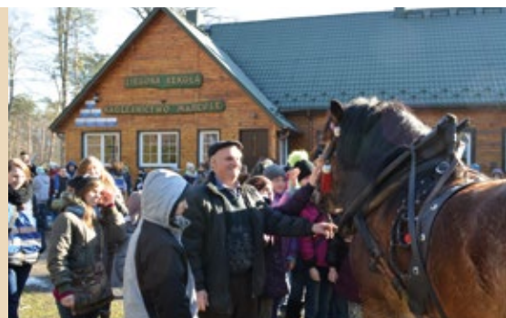
Ferie w Nadleśnictwie Marcule okazały się niezapomnianą przygodą

W zajęciach w Nadleśnictwie Marcule uczestniczyli dzieci i młodzież z Radomia, którzy ze względu na trudną sytuację materialną nie mają możliwości wyjazdu na zimowy wypoczynek. Na uczestników czekało wiele atrakcji. W Centrum Edukacji Przyrodniczej leśnicy opowiadali o lesie oraz pracy leśnika, historii nadleśnictwa i Puszczy Itzeckiej, a także zwyczajach zwierząt łownych. Były również atrakcje na świeżym powietrzu. W arboretum dzieci poznawały drzewa i krzewy posadzone tu w celach naukowych i edukacyjnych oraz zobaczyły zegar słoneczny. Jednak największej emocji wzbudził przejazd po lesie furmankami. Ciągnęły je prawdziwe konie! Na zakończenie wszystkie dzieci z całych sił i z głębi serca wykrzyczały „Dziękujemy!”. Mamy nadzieję, że pobyt w lesie i spotkanie z leśnikami będą długo wspominać!