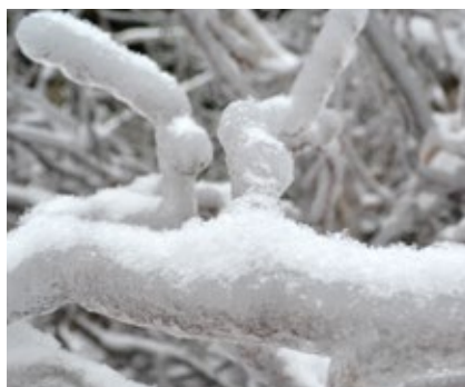
Gałęzie złamanej brzozy pokryte były kilkucentymetrową warstwą lodu (Nadleśnictwo Skarżysko)