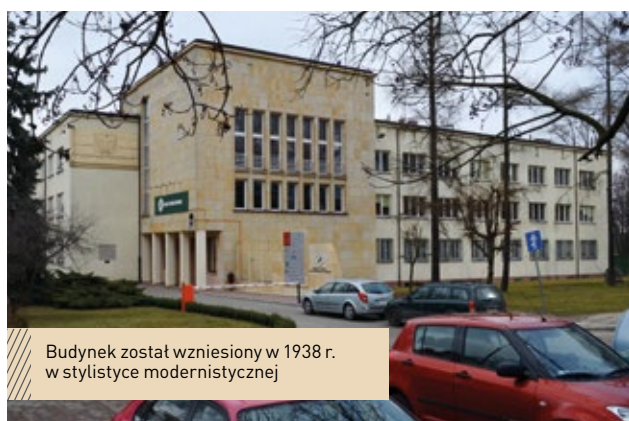
Budynek został wzniesiony w 1938 r. w stylistyce modernistycznej