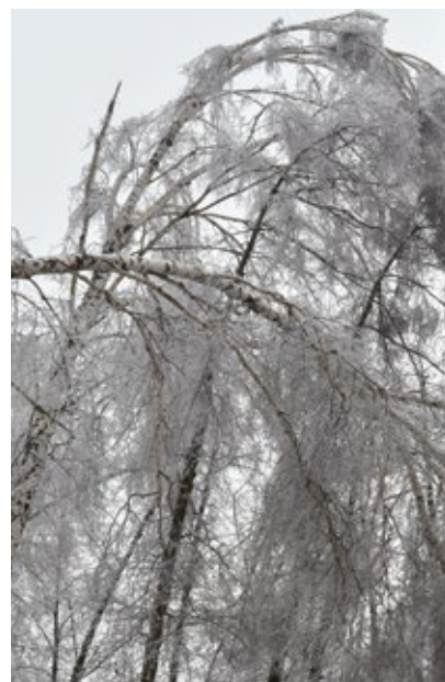
Najbardziej ucierpiały brzozy (Nadleśnictwo Skarżysko)